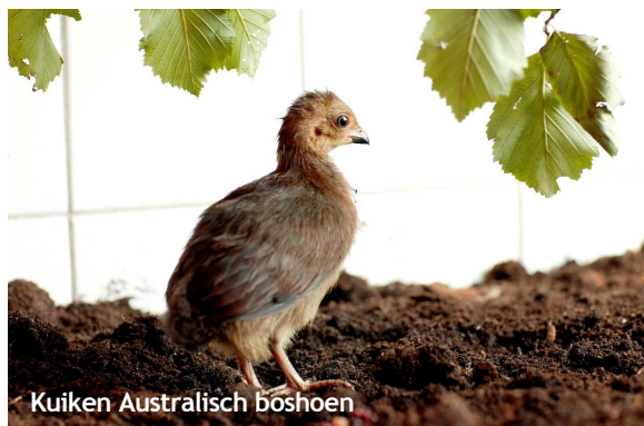
Kuiken Australisch boshoen